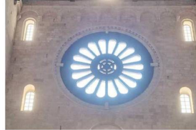
A sinistra l'affresco di San Gregorio Papa nella chiesa di San Benedetto dopo il restauro e sopra il rosone della Cattedrale di Bari

nuità di intervento ha consentito di affrontare in maniera organica le principali criticità conservative dell'edificio. I lavori più recenti hanno riguardato innanzitutto le coperture, oggetto di un intervento finalizzato a prevenire le infiltrazioni di acque meteoriche che nel tempo avevano compromesso le strutture e gli apparati decorativi interni. Particolare attenzione è stata riservata agli affreschi, attribuiti a Nicola Gliri e Francesco Antonio Altobello e raffiguranti Sante Benedettine, Pontefici e Virtu teologali. Nel corso del XIX secolo le superfici erano già state oggetto di un intervento di restauro da parte di Raffaele Afatato, in concomitanza con il rinnovamento architettonico della chiesa diretto da Sante Simone. Nel tempo, tuttavia, le infiltrazioni provenienti dalle coperture avevano causato la formazione di