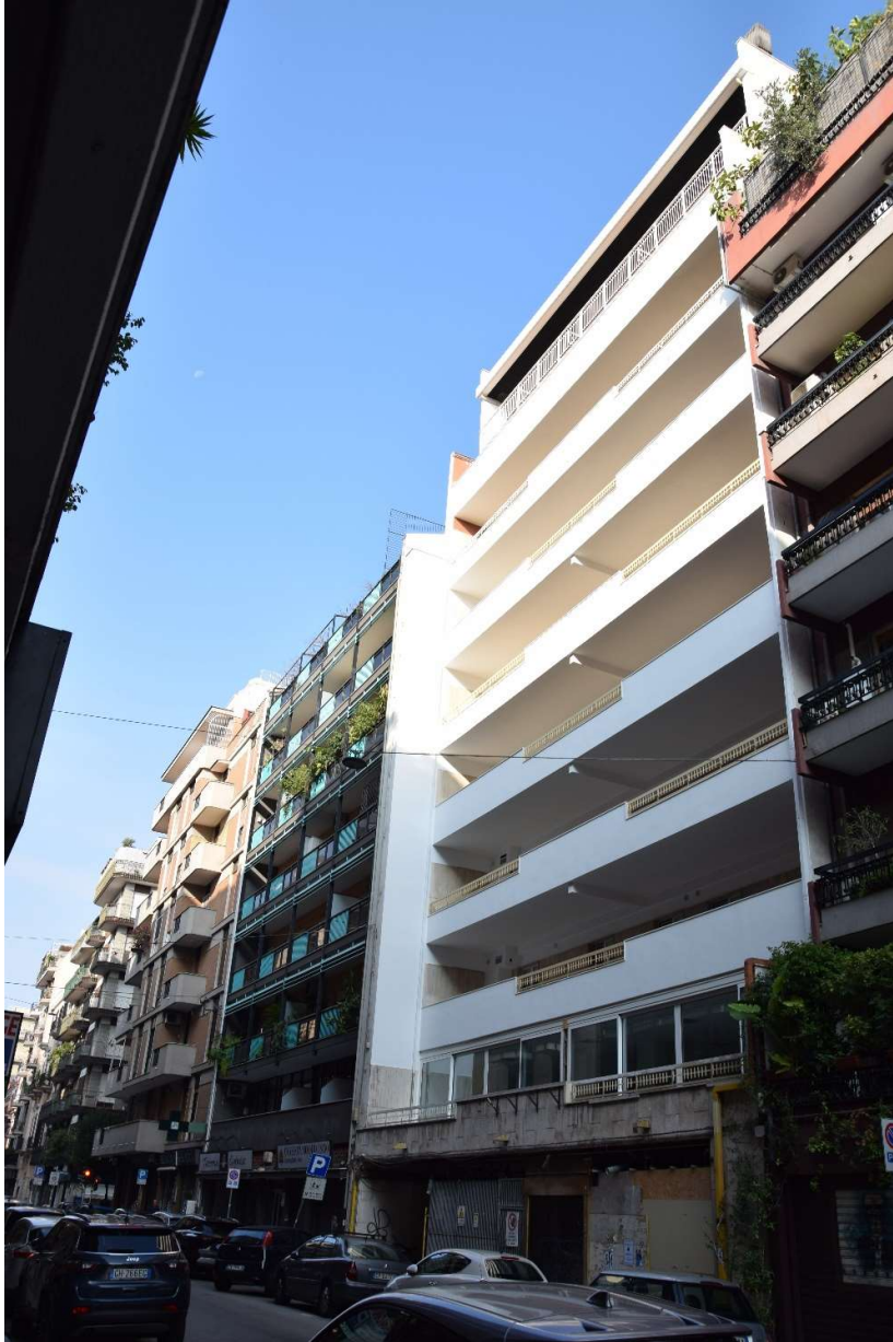
Immobile via Nicolai, n. 71