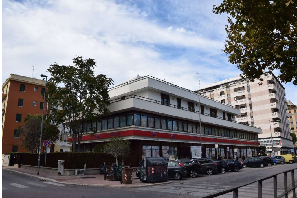
Palazzo di V.le della Repubblica – Bari