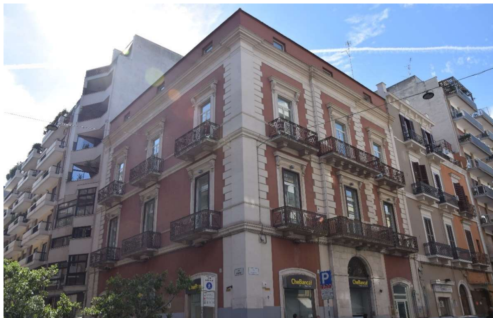
Palazzo di Via Calefati - Bari